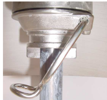
ステンレス鋳物製ホルダー

私たちは、お客様の身になったミキサー作りをモットーに いち早くご要望とご期待にお応えいたします。