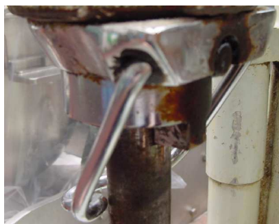
メッキ処理ホルダー / ホルダーバネ