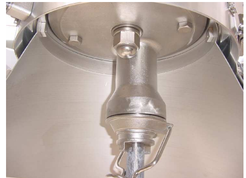
ステンレス製 偏心金物

私たちは、お客様の身になったミキサー作りをモットーに いち早くご要望とご期待にお応えいたします。